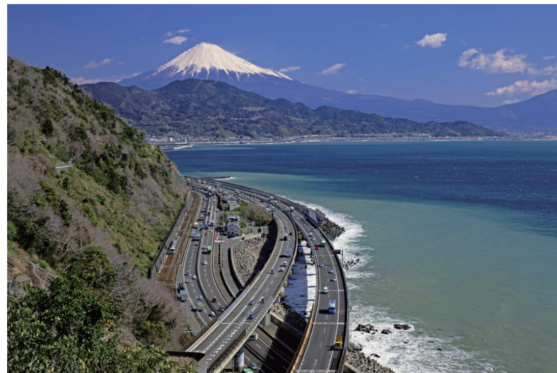
東海道と富士山 藤本雅之 静岡県