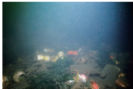
東京湾 中村征夫 東京都