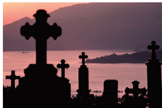
日本の心長崎より 林忠彦 長崎県