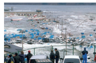
港を呑みこむ津波 岩手県

【出展予定作家】有田勉/飯田樹/飯田裕子/池田勉/石井真弓/石川裕修/石川梵/井田宗秀/猪井貴志/今村拓馬/岩木登/岩崎洋一郎/岩瀬修一/岩永豊/宇井真紀子/浦口橋一/大倉裕史/大塚勝久/大野隆志/大野基/大森一也/岡田茂/奥田倉之/奥山淳志/鍵井靖章/亀田昭雄/川廷昌弘/神崎順一/木村恵一/清永安雄/熊谷正/熊切圭介/熊切大輔/桑原史成/桑村ヒロシ/小池汪/小池良幸/郡山貴三/小関与四郎/小玉巨宏/小西忠一/小橋健一/小林禎弘/小松好雄/西條嘉吉/齋藤亮一/阪本博文/佐々木貴範/佐藤信一/志田信一/島田聡/清水重敏/清水哲朗/白井朝子/菅洋志/杉本光朗/鈴木康一/鈴木多聞(岩手日報)/鈴木智明/鈴木龍一郎/鈴原繁/平寿夫/高井潔/田上修/竹内敏信/田沼武能/田村仁志/辻博希/寺田義彦/栃尾臣尚/トム宮川コールドン/豊里友行/中川幸作/中田昭/中田健造/長根広和/永野一晃/中村征夫/中村武弘/中村庸夫/中村路入/西野嘉憲/野町和嘉/芳賀日出男/芳賀日向/橋本敏二/秦達夫/英伸三/早川哲/林忠彦/林義勝/広川泰士/福島雅光/藤本雅之/夫馬勲/古川誠/細川和良/前川貴行/前田欣一/松浦穂/松本徳彦/水越武/水谷祥彦/水本俊也/緑川洋一/南育孝/宮古漁業協同組合/宮武健仁/宮脇慎太郎/三好和義/村上修一/村田悠/安田菜津紀/山口一彦/山口規子/山田興司/山本剛士/山本皓一/山本将文/吉田範雄/米田堅持/和田直樹/渡辺英明 [以上123名 敬称略五十音順]